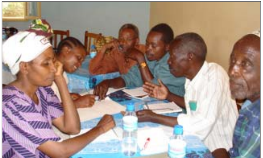
Watalamu wenza kutoka wilaya ya Mwanga wakiwa katika mafunzo