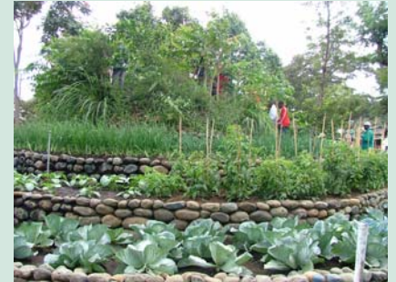
Wageni wakipanda Mlima Matumaini katika banda la TIP.

Shirika la TIP lilishiriki maonyesho ya 13 ya Kilimo na Mifugo (Nane Nane) 2005, yaliyoandaliwa na TASO kanda ya kaskazini katika viwanja vya Them, Arusha. Ujumbe wa TASO mwaka 2005 ni " Kilimo bora ni nyenzo muhimu ya kuondoa aina zote za umaskini".