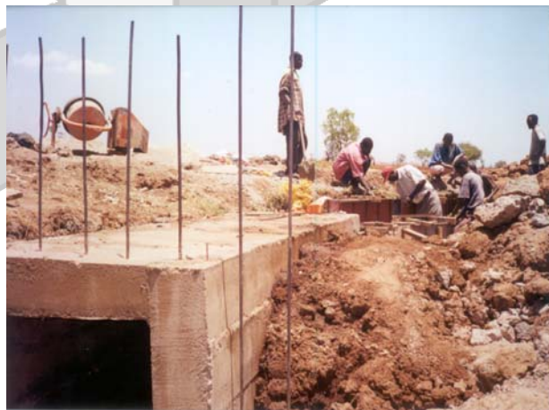
Ujenzi wa lango la maji katika mto Kiladeda

Matokeo yanayotegemewa kuwepo ni uongezekaji wa maji, usimamizi mzuri wa maji na ongezeko la uzalishaji litaihakikishia jamii kuwepo kwa chakula. Matokeo mengine ni utunzaji wa mazingira katika mto Kiladeda na maeneo ya mfereji mkuu.